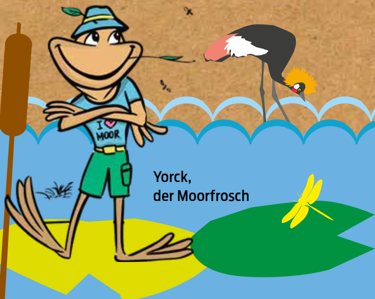
Yorck, der Moorfrosch

Oder musstet ihr schon mal vor einer hungrigen Kreuzotter fliehen und mit einem schlecht gelaunten Torfmoos diskutieren? Brrrh, ich kann euch sagen! Und dann der große Moorbrand – wenn ich als Chef der Froschfeuerwehr damals nicht ... Aber das könnt ihr euch alles selbst anhören, in unseren spannenden und lustigen Hörspielen!“