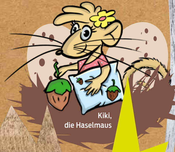
Kiki, die Haselmaus

„Eigentlich bin ich gar keine Moorbewohnerin. Aber als Haselmaus lebt es sich heute auch nicht leicht. Überall Straßen, Häuser und Äcker. Wo soll man da einen Platz zum Schlafen finden? Darum bin ich mit Sack und Pack ins Moor umgezogen. Anfangs war das ganz schön ungewohnt, aber zum Glück habe ich Yorck getroffen. Der kennt von Neustadt bis Altwarmbüchen jedes Wasserloch! Mit Yorck zusammen erlebe ich jeden Tag etwas Neues. Wir treffen kriminelle Elstern und verrückte Moormaler, einen verfressenen Kranich und viele andere ulkige Typen. Langweilig wird das nie und nebenbei lerne ich eine Menge über das Moor.“